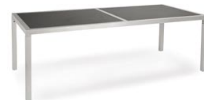
Tisch Atlanta Aluminiumrahmen in silber mit eingearbeiteter Tischplatte aus Aluminium-Wabenkonstruktion mit granitfarbener Oberfläche, in zwei verschiedenen Größen.

Weitere passende Tischvariationen, hier z.B. Klappstisch Boulevard silber-carrara, finden Sie auf Seite 54-55