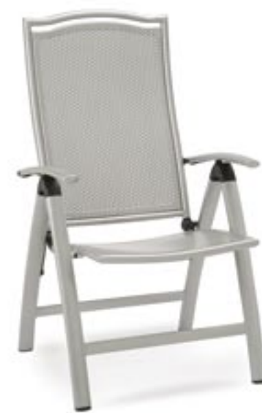
Klappsessel Madison hohe Rückenlehne, mehrfach verstellbar Art.-Nr. 46120085

Kühles Aluminium und interessante Oberflächenstrukturen charakterisieren die Serie „Madison“.