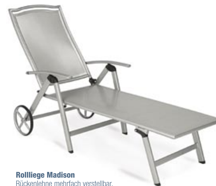
Rollliege Madison Rückenlehne mehrfach verstellbar, zusammenklappbar Art.-Nr. 46140085